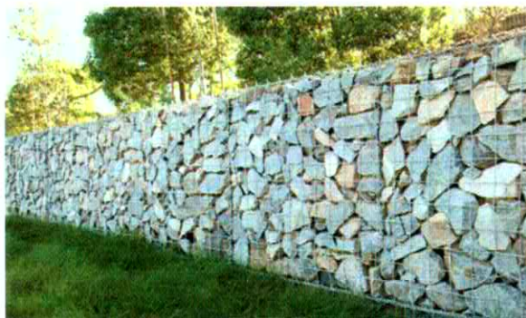
Példa a gabionfalas partfal kialakításra

Válasz: A szerző gabion falas megoldást irányozna elő a partéltre, elvágva ezzel a teljes parti közterületet a Dunától. Ha a parti sétány kialakításához ilyen gabion falat építenek, akkor az milyen magas kell legyen, hol marad a sétány és a fővény kapcsolata?